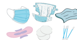
Masques, couches, articles d'hygiène, mouchoirs et serviette en papiers