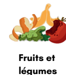
Fruits et légumes