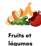
Fruits et légumes