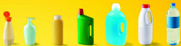
TOUS LES FLACONS, BIDONS ET BOUTEILLES PLASTIQUES