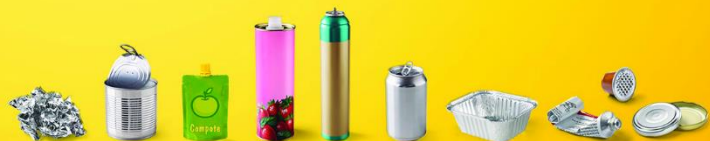
TOUS LES EMBALLAGES EN MÉTAL