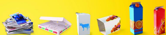
TOUS LES PAPIERS ET LES CARTONS