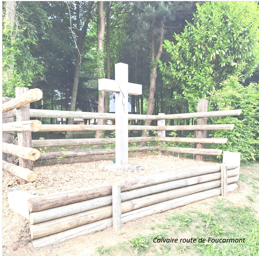
Calvaire route de Foucarmont