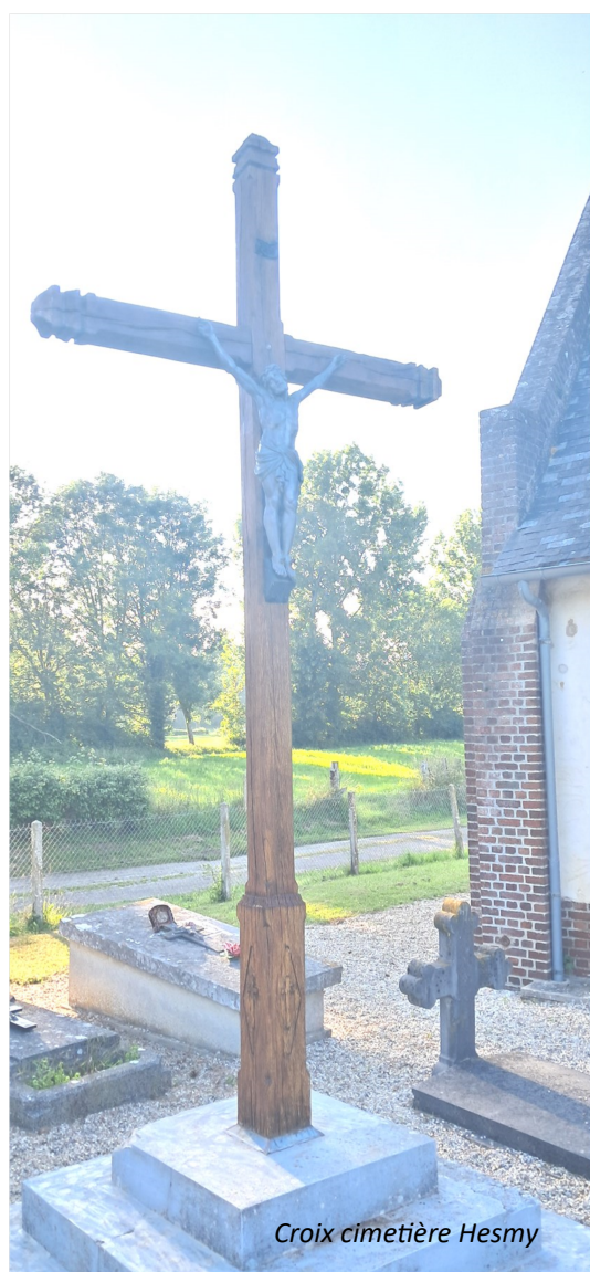
Croix cimetière Hesmy