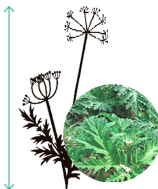
Berce du Caucase

* Partout en Normandie avec un nombre de foyers important dans le Calvados et la Seine-Maritime