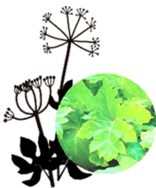
Berce commune (carotte sauvage)