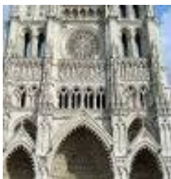
La Cathédrale Notre-Dame

Peu après s'être installés pour le déjeuner, nous sommes partis voguer, sous le soleil, sur les flots de la Somme durant deux heures trente.